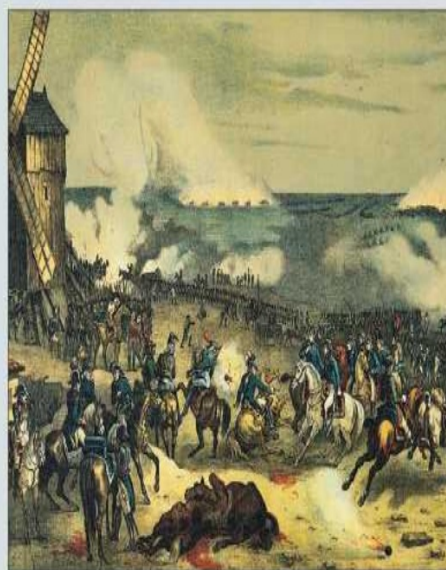
La bataille de Valmy, 1792

Avant la Révolution, l'armée était un privilège de la noblesse. Pour être officier, il fallait être noble ou acheter sa charge. ° Les soldats étaient des engagés ° et des mercenaires étrangers. Les armées de la Révolution incorporèrent les Français de toute condition sociale. À la bataille de Valmy (20 septembre 1792), l'armée française cria pour la première fois: «Vive la Nation!»